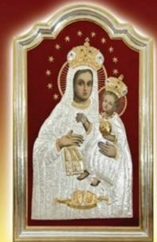
Koronacja obrazu Matki Bożej Oleskiej i Akt zawierzenia miasta Olesna opiece Matki Bożej